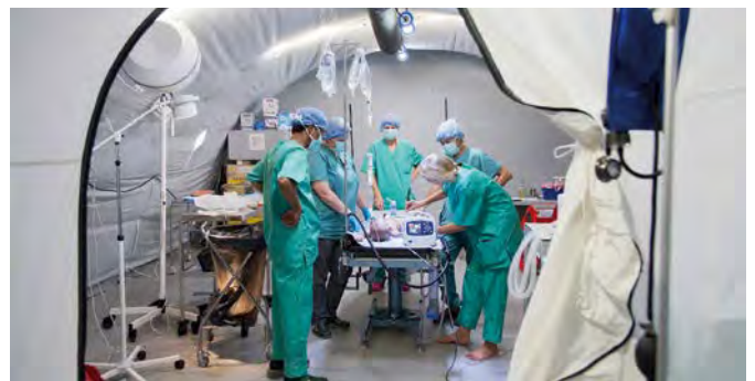
Operationssaal im mobilen Krankenhaus

Das aktuelle Beispiel dafür ist das Feldkrankenhaus in Gaza, das Anfang des Jahres 2024 in der Stadt Rafah in Betrieb gegangen ist – und in dem bis Dezember 2025 bereits fast 200.000 Menschen behandelt wurden. Aus allen fünf Ländern sind Teile dort, Deutschland stellt aktuell gut ein Drittel des Krankenhauses. Genauso international ist das Rotkreuz-Team, das dort arbeitet – denn auch bei dem in der Regel eh-